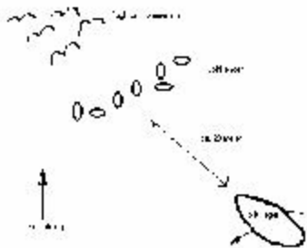
Eksempel på plassering av lokkefugl ved jakt fra båt

Vannapporterende hund er en nyttig jaktkompis som kan spare deg for mange turer med robåten. De fleste fuglene vil lande i vann etter at de er skutt. Men vær trygg på hunden din og hva den har kapasitet til. Det kan være sterke strømmer og kaldt vann som gjør det vanskelig for hunden å svømme. Husk varmedekken eller pose til hunden slik at den ikke blir sittende våt