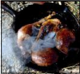
Kjøttet kan steikes umiddelbart som en god avslutning på jakta.

Det marine smakspreget kan reduseres under tilberedning.