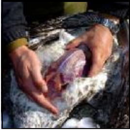
Flå av skinn for hånd og fjern synlig fett